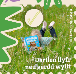
Darllen llyfr neu gerdd wyllt

Dyma ychydig o syniadau i chi ddechrau arni, faint allwch chi eu ticio?