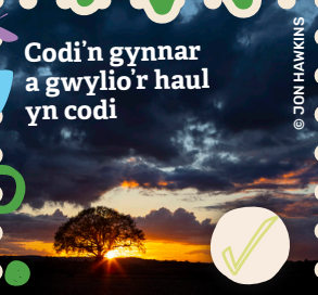
Codi'n gynnar a gwyllo'r haul yn codi