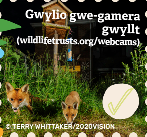
Gwyllo gwe-gamera gwyllt (wildlifetrusts.org/webcams)