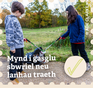
Mynd i gasglu sbwriel neu lanhau traeth