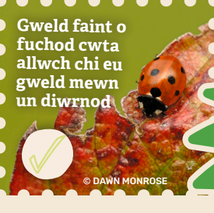
Gweld faint o fuchod cwta allwch chi eu gweld mewn un diwrnod