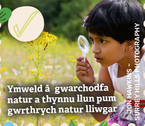
Ymweld â gwarchodfa natur a thynnu llun pum gwrthrych natur lliwgar