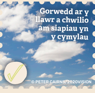
Gorwedd ar y llawr a chwilio am siapiau yn y cymylau