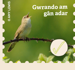
Gwrando am gân adar